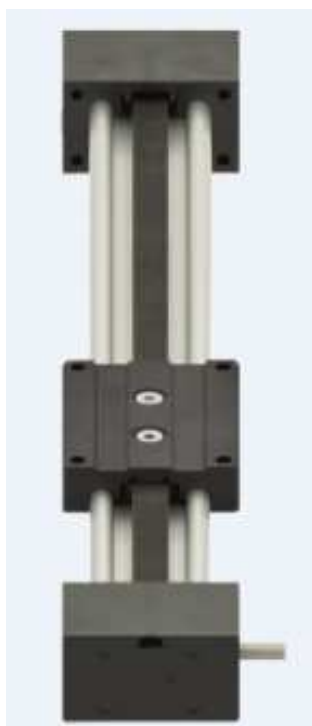
写真③：ユニット品ではない従来のドライリンZLW